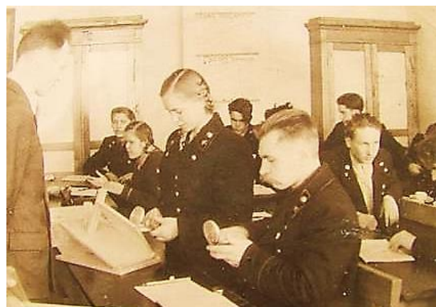
Студенты горного техникума, пос. Ис.

2 октября 1940 года принят Указ Президиума Верховного Совета СССР «О государственных трудовых резервах СССР», целью создания было образование единой государственной системы подготовки квалифицированных специалистов и планомерная массовая подготовка квалифицированных рабочих.